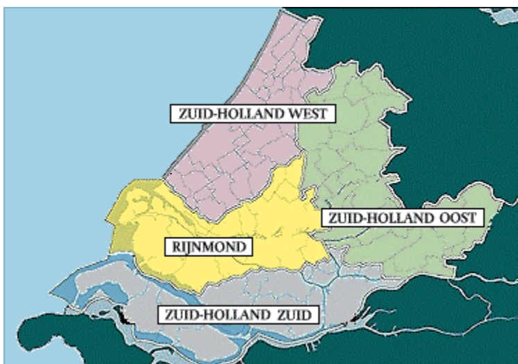
Figuur 1-3: Streekplanregio's van de provincie Zuid-Holland

Het streekplan Zuid-Holland Zuid, vastgesteld in mei 2000, omvat het kustgedeelte Goeree Overvlakkee en deelgebied Hoeksewaard.