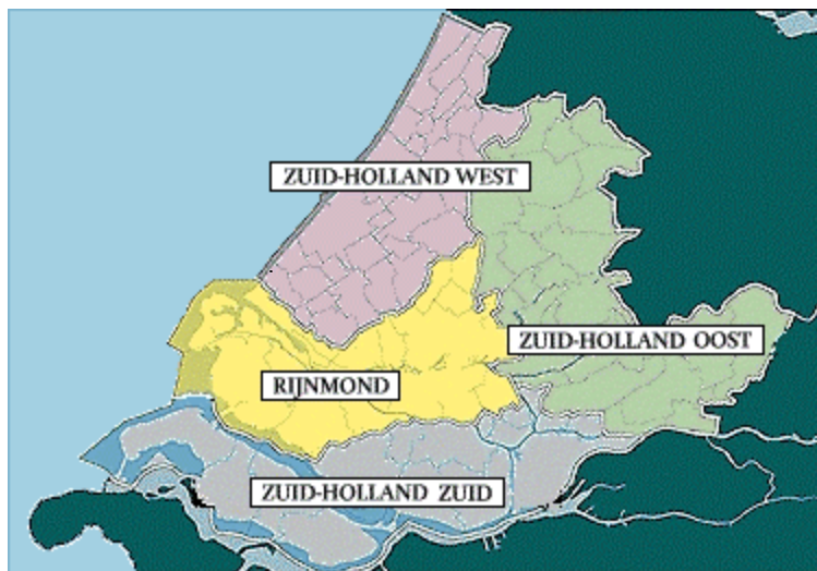
Figuur 5-3: Streekplanregio's van de provincie Zuid-Holland

Het kustgerelateerde beleid van de provincie Zuid-Holland is beschreven in drie verschillende streekplannen. Daarnaast is voor Zuid-Holland West ook het ontwerpstreekplan meegenomen.