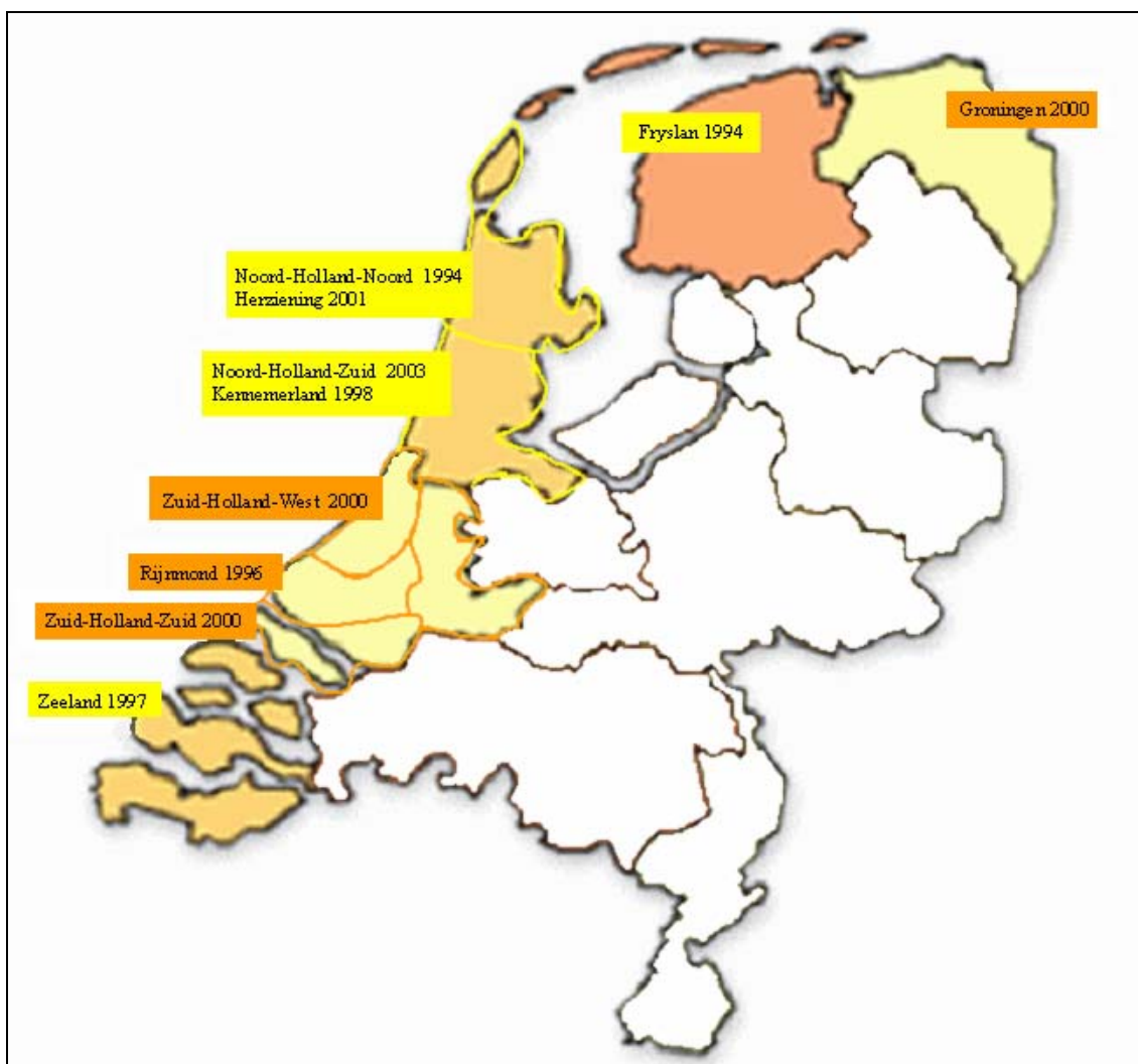
Figuur 1-1 Overzicht van de streekplanregio's van de geïnventariseerde streekplannen

Daarnaast is in de inventarisatie het Concept-Startdocument Streekplan (oktober 2002) meegenomen, aangezien hierin veel kustzonegerelateerde onderwerpen behandeld worden. Dit plan is een ambtelijk stuk. De definitieve versie van het startdocument is op 2 december aan de Statencommissie voorgelegd. Op het moment van schrijven van het onderliggende rapport is nog geen definitieve versie beschikbaar.